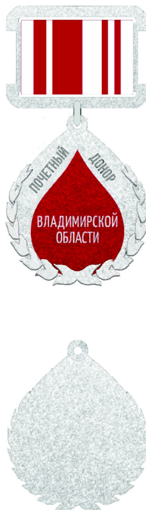
РИСУНОК ПОЧЕТНОГО ЗНАКА «ПОЧЕТНЫЙ ДОНОР ВЛАДИМИРСКОЙ ОБЛАСТИ»